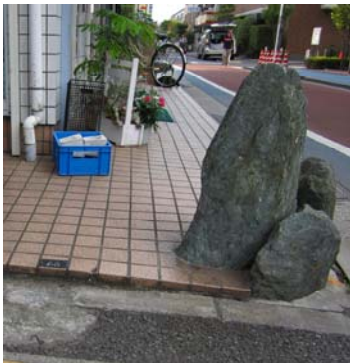
(北側道路から撮影)