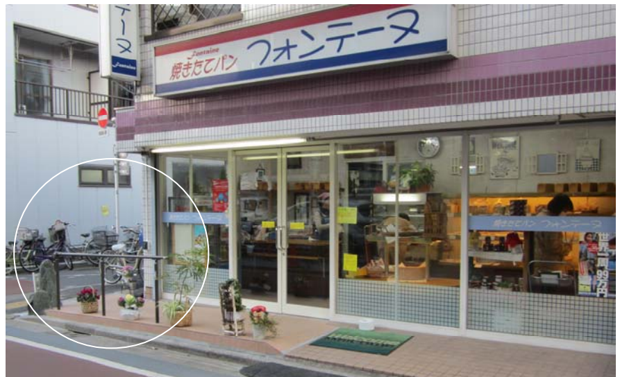
お店のドアを軽い力で開く引き戸に改修（ドアの取っ手も握りやすい棒状のものにしました。）

また、ドアの近くにインターホンを設置し、車いすの方がお店に入るときに、お店の人の介助も利用できるようにしました。