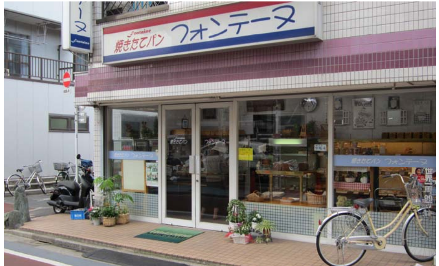
お店のドアは手前に開くドアでした。