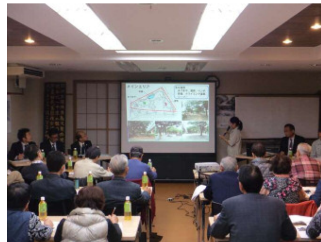
説明会開催の様子