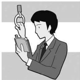
交通機関利用者数 (26年度) J R 159,757人 (乗車) 京成 139,414人 (乗車) 北総 31,886人 (乗車)