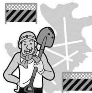
区道路 (27.4.1) 総道路面積に対して 66.2%