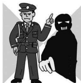
犯罪件数 (26年) 15.4件