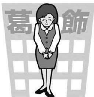
区一般職員数 (27.4.1) 2,962人