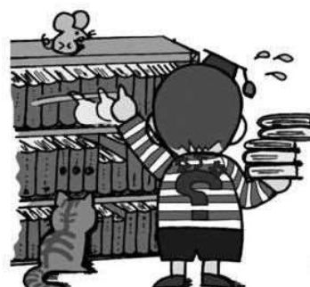
図書館蔵書数 (27.4.1) 1,251,384冊