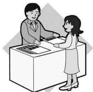
請願件数 (26年) 5件