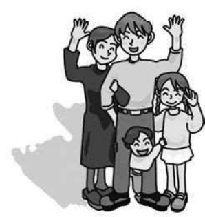
転 出 (26年) 55.7人