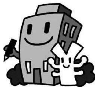
事業所数 (24.2.1) 17,779