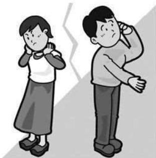
離 婚 (26年) 2.5組