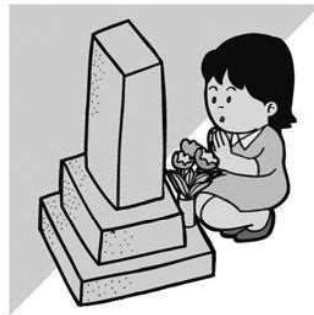
死 亡 (26年) 11.8人