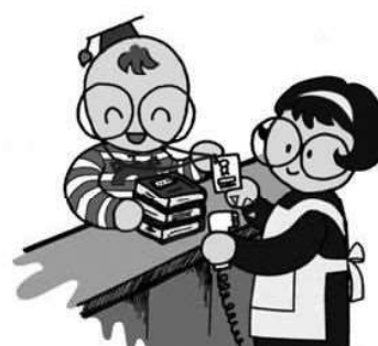
図書貸出数 (26年度) 9,129冊