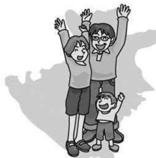
転 入 (26年) 58.3人