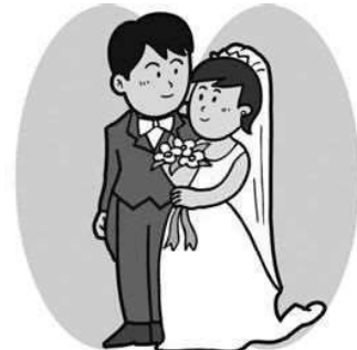
婚 姻 (26年) 6.3組