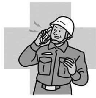
救急出動回数 (26年) 71.3回