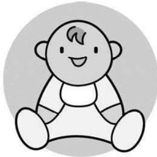
出 生 (26年) 10.2人