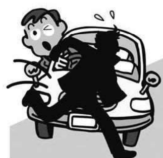
交通事故件数 (26年) 1.9件