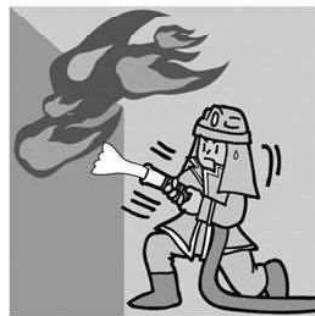
火災件数 (26年) 0.3件