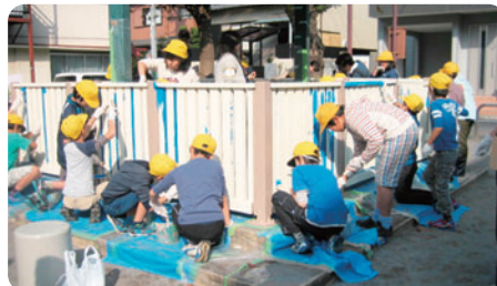
ペイント活動の様子

担当教員、PTA本部役員、学年委員の皆さんが事前に打ち合わせを重ね、今回初めて授業の中で実施することができました。