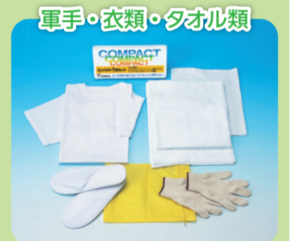
軍手・衣類・タオル類