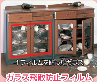
↑フィルムを貼ったガラス ガラス飛散防止フィルム