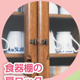
食器棚の 扉ロック