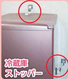
冷蔵庫 ストッパー