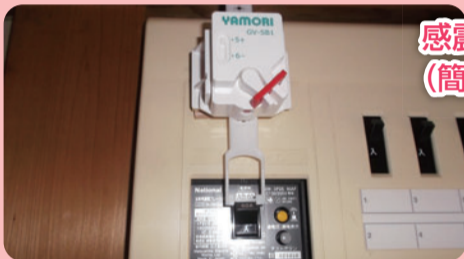
感震ブレーカー (簡易タイプ)