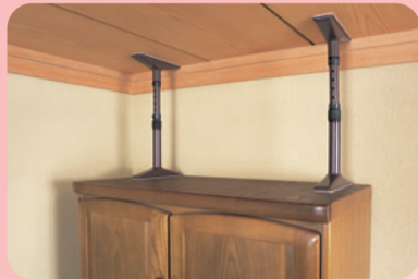
家具転倒 防止器具