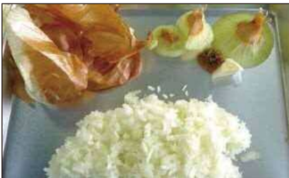
上の皮が廃棄する部分