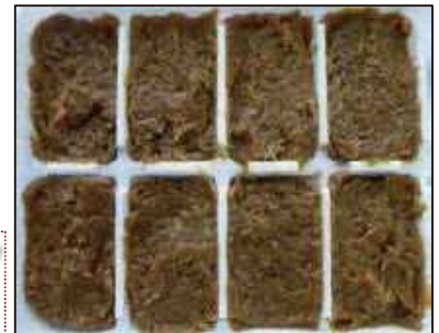
みじん切りして炒めたものを冷凍保存する場合、小分けしておくとう便利です

丸のままの玉ねぎは、傷んだ部分がない場合、常温で風通しが良く日の当たらない場所が長持ちします。夏場や新玉ねぎなどは冷蔵保存し、なるべく早く使いましょう。 CHECK! みじん切りして炒めたものを冷凍保存した場合は、1ヶ月を目安に使い切りましよう。