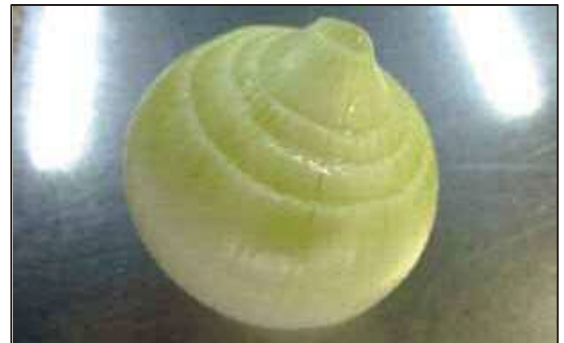
食べられるぎりぎりの部分でカットしたもの