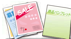
チラシ・パンフレット