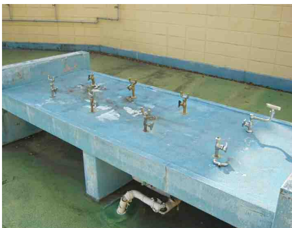
東柴又小目洗い場