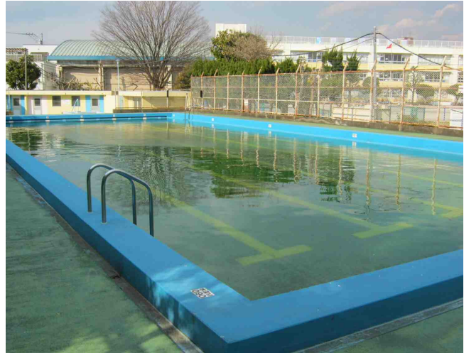
東柴又小学校プール(25m)