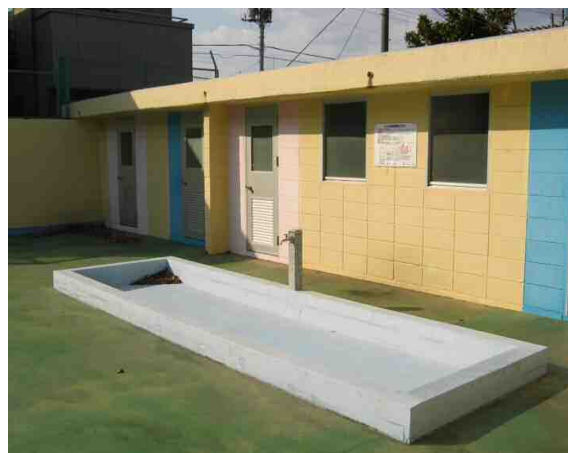
東柴又小足洗い場