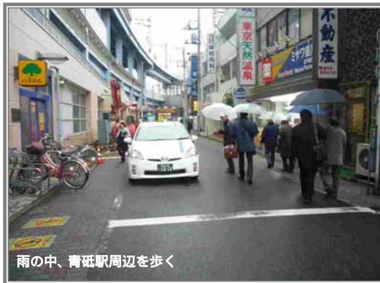
雨の中、青砥駅周辺を歩く