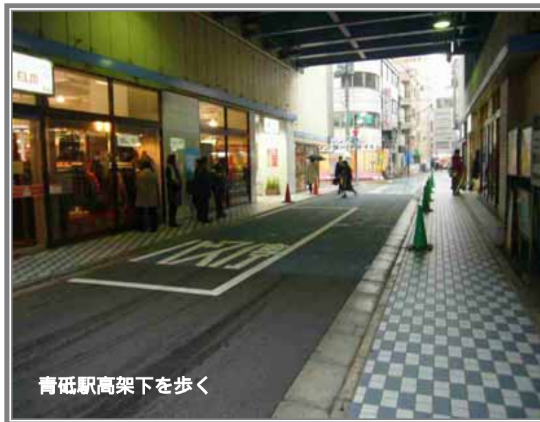
青砥駅高架下を歩く