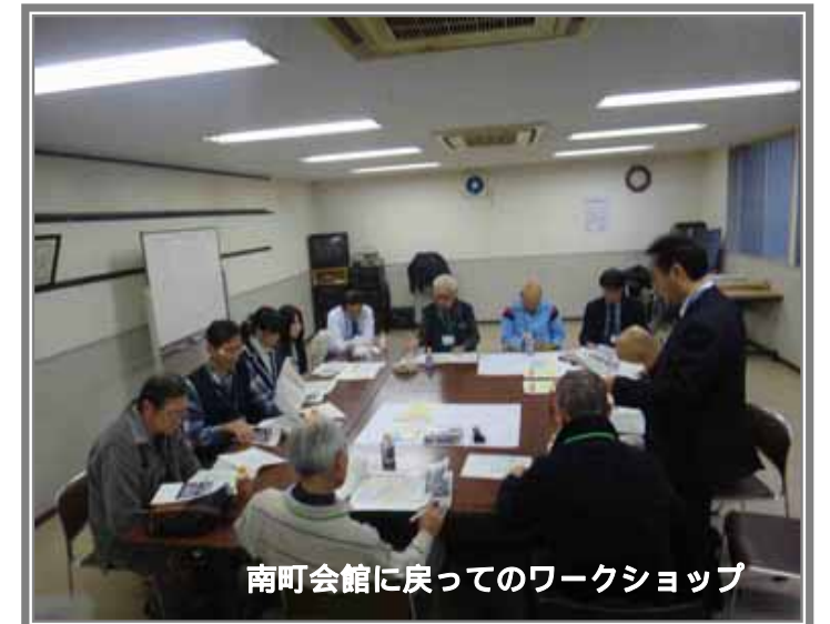
南町会館に戻ってのワークショップ

まち歩きから戻った後、歩いたことで分かったまちのいいところや改善したいところ、高砂で鉄道立体化が行われる時には参考になることなどについて、地図に書き込みながら、熱意あふれる意見交換を行ないました。