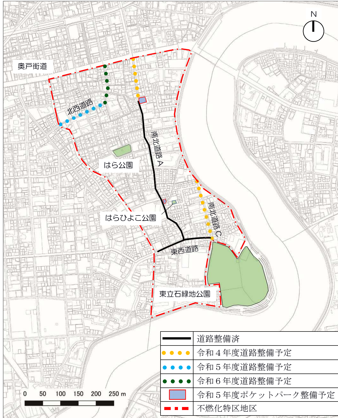
【道路整備の状況】（令和2年12月末時点）

密集事業による、幅員6mの主要生活道路やポケットパークは、地権者ほか関係者の皆様のご理解とご協力により、令和6年度までの整備を目指して進めてまいります。