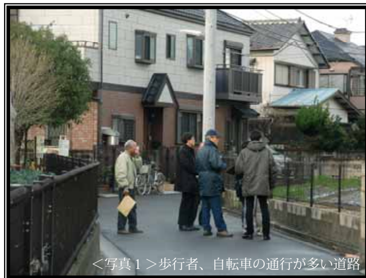
<写真1> 歩行者、自転車の通行が多い道路