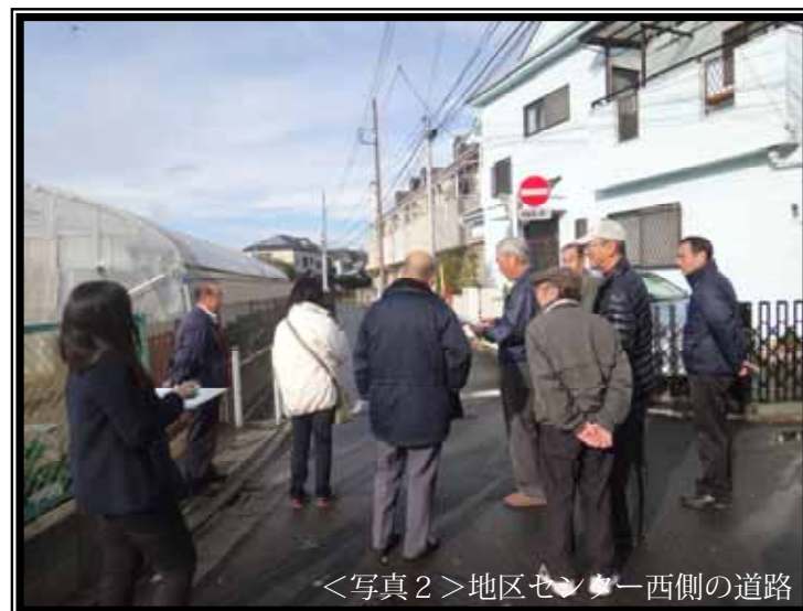
<写真2> 地区センター西側の道路