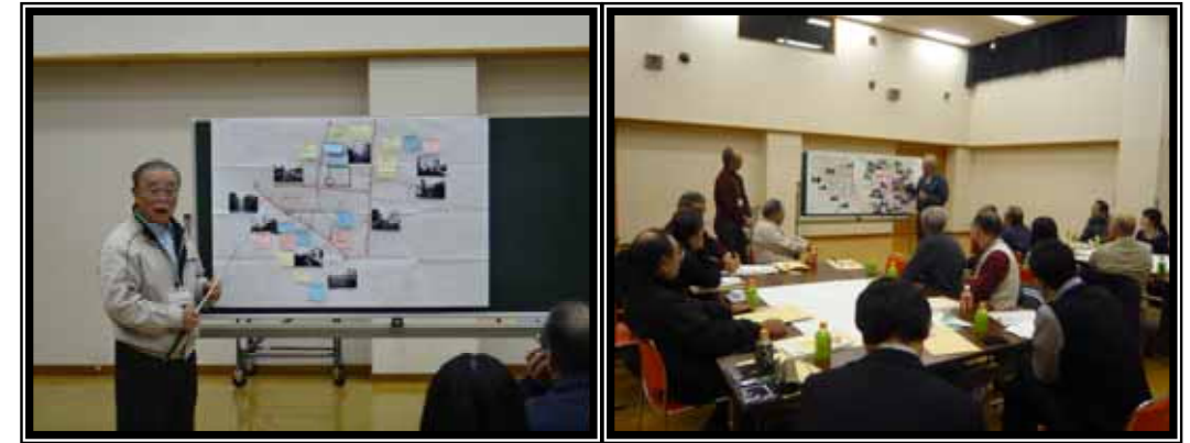
各グループの代表者による発表の様子

まち歩きから戻った後、歩いてわかったまちの現状や改善したいところなどについて、南地区の地図に書き込みながら、熱意あふれる意見交換を行ないました。