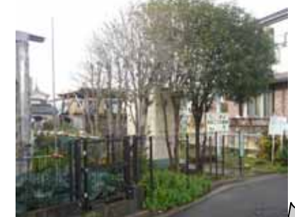
<写真3> 区民農園の緑