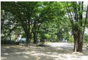
緑陰の中を駆け回れる広場