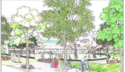
東の入口ひろば 整備イメージ