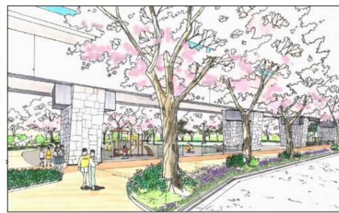
みんなのかだんロード（西側）整備イメージ