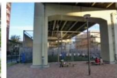
ネットで囲われたボール遊び場