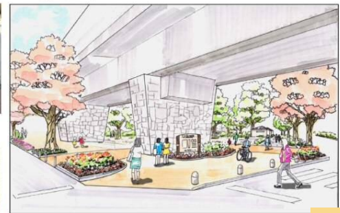
みんなのかだんロード（駅側）整備イメージ