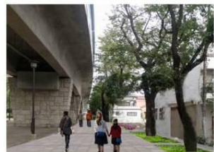
明るい草花で彩る広々とした園路