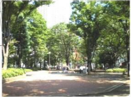
広々として入りやすい入口