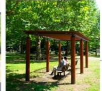
パーゴラ下のベンチ