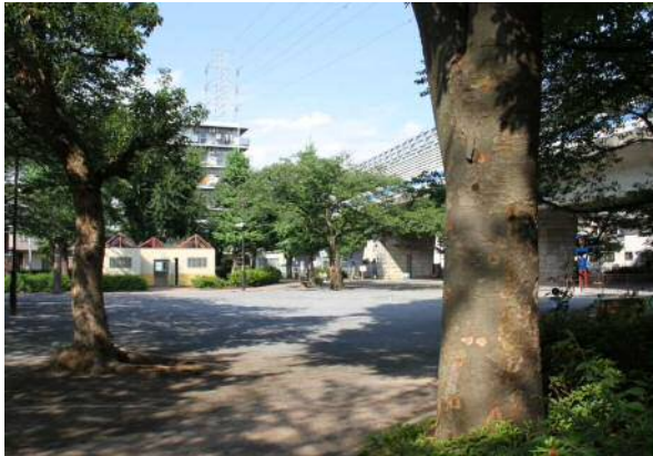
現在の鎌倉公園写真