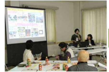
② 鎌倉公園改修案の説明