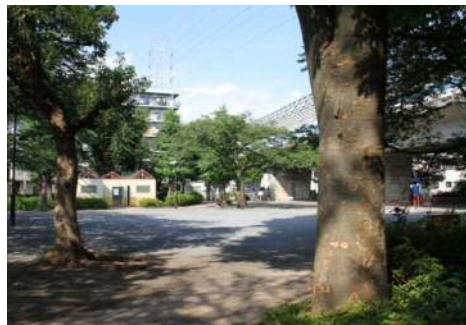
現在の鎌倉公園写真