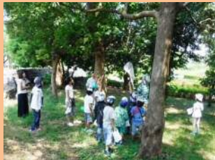
セミの抜け殻標本作り（水元公園）