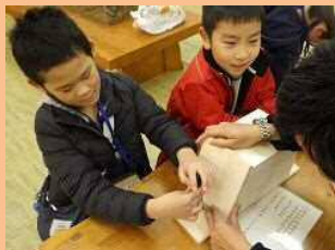
鳥の巣箱づくり（二子玉川公園）