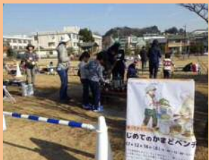
かまどベンチを使って炊出し（二子玉川公園）