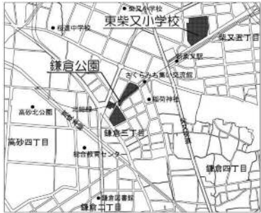
位置図(鎌倉公園、東柴又小学校)

今回は検討会の最終回であり、これまでの意見を踏まえた改修案について、班ごとに意見交換を行い、各班の意見を発表したうえで、検討会としての改修案がまとまりました。