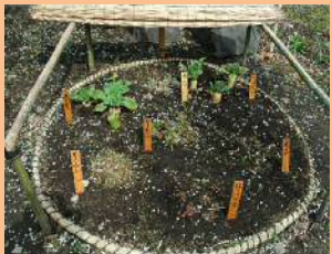
冬の展示【春の七草】（向島百花園）