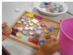
モザイクタイル作り