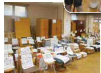
リユース家具無料提供コーナー