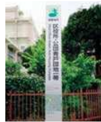
避難場所 避難地点