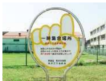
一時集合場所 臨時集合地点