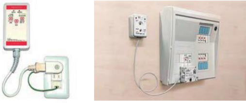
新しく対象機種になった感震ブレーカーの例

感震ブレーカーは、大きな地震が発生した際、自動的にご家庭の電気を遮断し、電気火災を防止する機器です。10月から設置費用補助の対象地域および対象機種が広がりました。