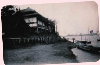
シリーズ 葛飾と水① 近代以降の水害年表