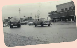
シリーズ 葛飾と水⑥ 用水から親水公園へ シリーズ 葛飾から全国へ 映画「男はつらいよ」 漫画「こちら葛飾区亀有公園前派出所」 漫画「キャプテン翼」