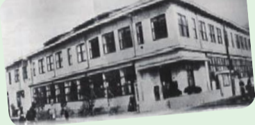
シリーズ 葛飾と水④ 河川と産業 シリーズ 葛飾と水⑤ カスリーン台風と水塚