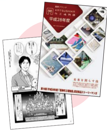
認定製品や技術をマンガで紹介しします

関係機関のお知らせ 街頭労働相談 【日時】5月26日(金)正午～午後3時30分(会場)上野御徒町駅構内(都営大江戸線)【内容】労働相談・パネル展示【問い合わせ】東京都労働相談情報センター1亀戸事務所☎(3682)6321