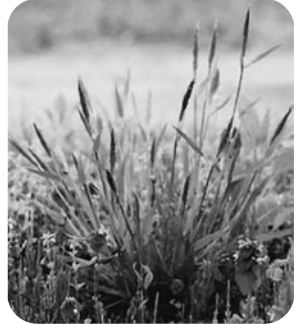
ハルガヤ 枝が短いため花が穂状に見えるのが特徴です。早いもので3月中旬に開花します。