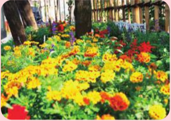
葛飾区長賞 上小松四季の会(奥戸4-1-4)