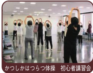
かつしかはつらつ体操 初心者講習会

「かつしかはつらつ体操 初心者講習会」「農業応援サポーター養成講座」「災害ボランティア基礎講座」など、さまざまなボランティア活動や地域活動を学びます。