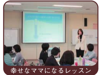
幸せなママになるレッスン

「幸せなママになるレッスン」「知って得する年金講座」「健康大学」「シルバーカレッジ」「大学との連携公開講座」など、社会の課題から暮らしの知恵までを幅広く学びます。