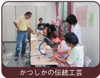
かつしかの伝統工芸

「かつしかの伝統工芸」「かつしかの地名と歴史」「写真と文章で伝える私のかつしか」など、葛飾の特徴や魅力を学びます。