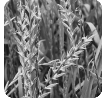
ネズミホソムギ 河川敷や堤防、公園などで多く見られ、5月から7月にかけて開花します。