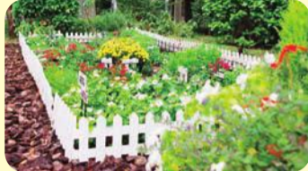
かつしか花いっぱいのまちづくり推進協議会会長賞 西新小岩リバーハイツ団地自治会(西新小岩2-1)