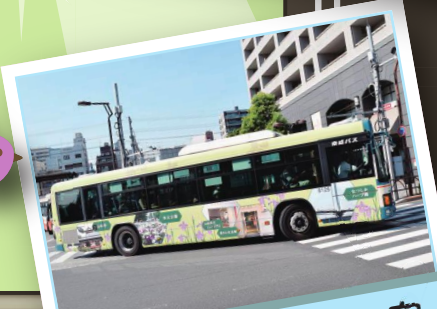
交通利便性の向上