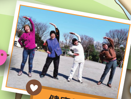
健康長寿を後押し