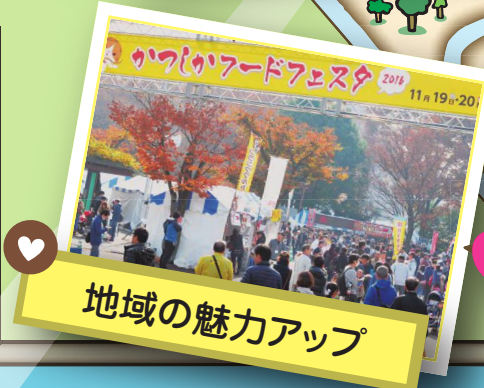
地域の魅力アップ