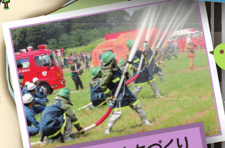
安全・安心なまちづくり