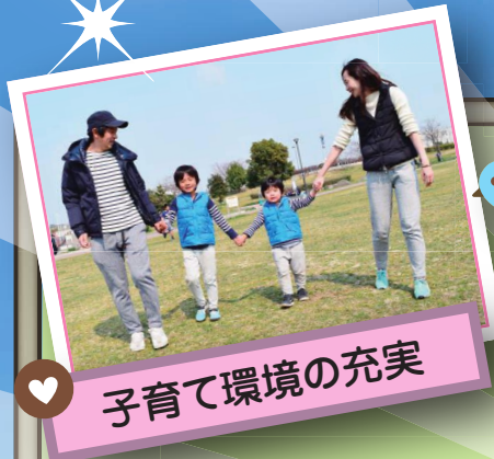
子育て環境の充実