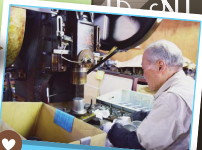
ものづくりを応援