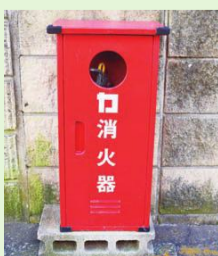
街路消火器格納箱

区では、区内の道路上など、約8,300カ所に街路消火器を設置しています。この消火器は火災発生時にはどなたでも使用できます。