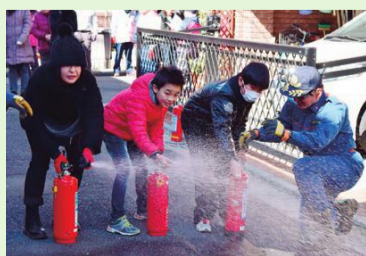
金町睦自治会での消火訓練の様子

お住まいの地域の防災訓練の情報は、区ホームページ(トップ→くらしのガイド→防災・防犯→地域防災活動の紹介→防災訓練予定一覧)からご覧になれます。