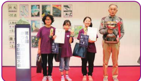
新宿地区代表の皆さん