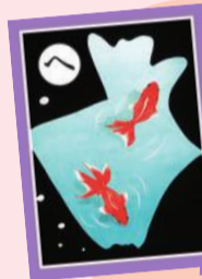
へえほんど 金魚の形 葛飾区

区では、郷土を学ぶことができる教材として、毎年区内の小学3年生の全児童に配布し、授業での活用を進める他、競技大会や地域のイベントなど、さまざまな場面での活用を進めています。【担当課】 生涯学習課 ☎5654 - 8475