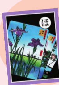
ほ 堀切の 菖蒲を描く 江戸百景