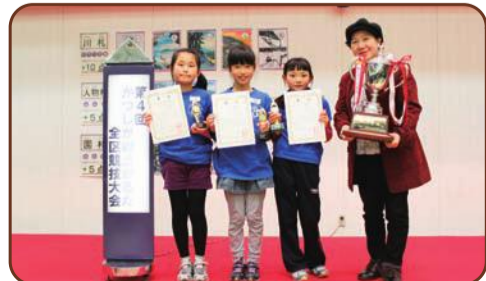
金町地区代表の皆さん