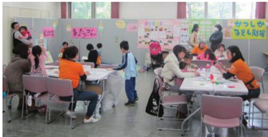
工作コーナー・乳幼児コーナー