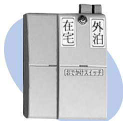
生活リズムセンサー