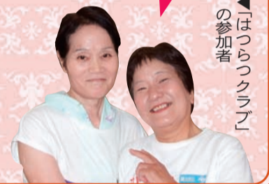
▲「はつらつクラブ」の参加者