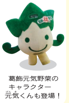
葛飾元気野菜のキャラクター 元気くんも登場！

凡例 日時 会場 対象 定員 内容 保育 会場 方申込方法 申込先 師講師 費用 持ち物 その他 方申込方法 申込先 師講師 費用 持ち物 お問い合わせ先 担当課