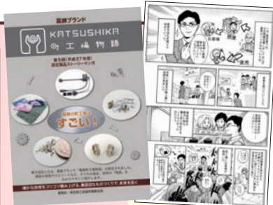
▲平成27年度認定作品 ストーリー漫画

【対象】 認定製品の取材を行い、ストーリーを組み立てた上で漫画化できる方(プロ・アマ不問)5人程度