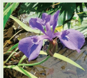
▲かれんに咲く杜若

した。現在でも菖蒲の葉を湯船に入れた菖蒲湯に浸かりますが、これも本来は、邪気を祓い、体を浄めるためのものだったのです。しかし、「菖蒲の刀」「菖蒲の枕」「菖蒲茶」よりも多く古典に登場するのは、菖蒲を軒や門に連ね挿し置く風習です。例えば、清少納言の『枕草子』や西行の『山家集』などの著名な文学作品には、5月の季節感を美的に象徴する行事として、「菖蒲を連ね挿し置く」描写が記されています。また、『枕草子』89段の「なまめかしきもの」では、「古い新しいに關係なく、檜皮葺屋根の濃い茶色と連ね挿し置かれた菖蒲のみずみずしい緑色とのコントラストがとても魅力的だと評しています。