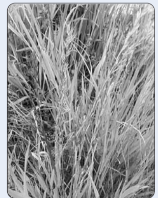
ネズミホソムギ 都内では河川敷、公園などで多く見られます。