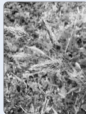
ハルガヤ 道端や河原に生息し、枝が短いため花が稲状に見えるのが特徴です。