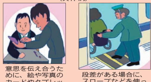
意思を伝え合うために、絵や写真のカードやタブレット端末などを使う。

障害のある方から、社会的障壁を取り除くために何らかの対応を必要としているとの意思が伝えられたときに、負担が重すぎない範囲で対応すること。