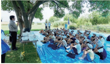
小学生を対象にした出前授業の様子