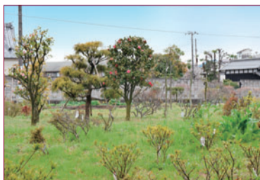
さまざまな植木が仮植されているグリーンバンク