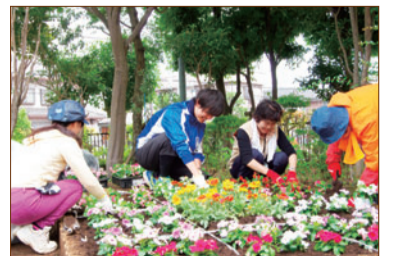
地域団体の方々の花の植え替え活動

活動や参加方法など詳しくは、かつしか花いっぴいのまちづくりホームページ( https://www.hanaichi-katsushika.jp/ )をご覧ください。か、環境課(☎5654 - 8239)へお問い合わせください。