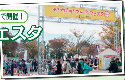
【担当課】 商工振興課