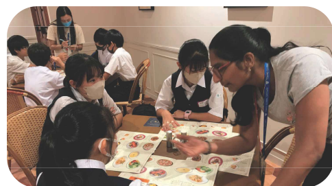
英語体験プログラム ～TOKYO GLOBAL GATEWAY～