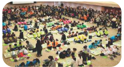
かつしか 郷土かるた 全区競技大会