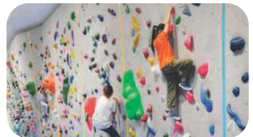
東金町運動場 スポーツクライミング センター