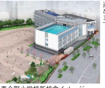
東金町小学校新築校舎イメージ