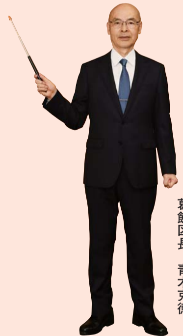
葛飾区長 青木克徳