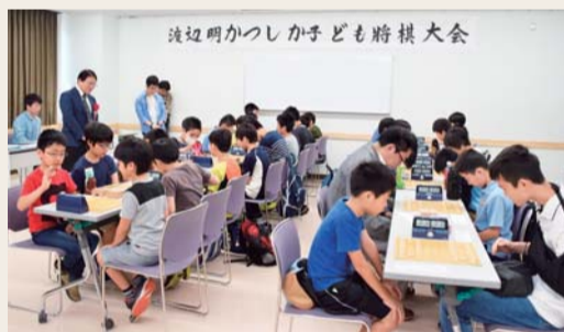
渡辺明かつしか子ども将棋大会