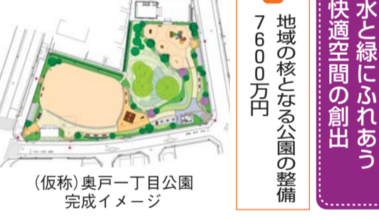
(仮称)奥戸一丁目公園完成イメージ