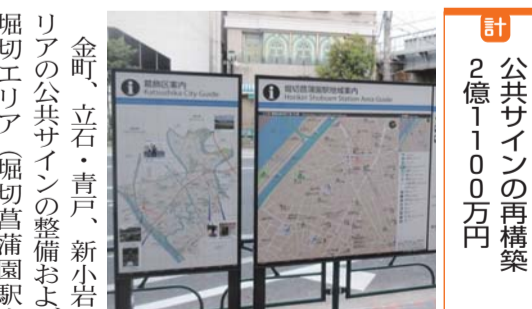
公共サインの再構築