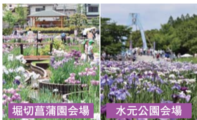
堀切菖蒲園会場 水元公園会場

5月27日〜6月16日の期間、葛飾菖蒲まつりが開催されました。堀切菖蒲園会場では花菖蒲の人気投票やパレードなどが行われ、水元公園会場では民謡踊りやカラオケ大会などが行われました。今年も多くの方が咲き誇る花菖蒲を見たり、イベントなどを楽しんだりしていました。