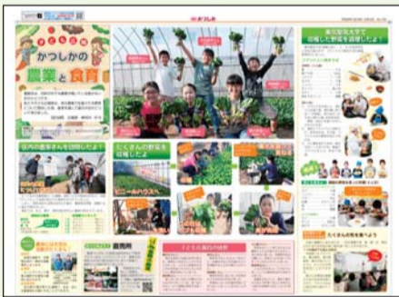
平成30年度 子ども広報特集記事

【活動場所】 水元公園(集合・解散/葛飾区役所) 【対象】 区内在住の小学4年生～中学1年生で、紙面に自分の写真を掲載してもよい方5人程度 【申込方法】 メールか往復ハガキに「子ども広報」・住所・氏名(フリガナ)・年齢(学年)・電話番号・保護者の氏名(フリガナ)を書いて、7月10日(水)(必着)まで(多数抽選)。 【申し込み・担当課】 〒124-8555 葛飾区役所広報課 ☎5654-8116 ✉020800@city.katsushika.lg.jp