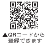
▲QRコードから登録できます