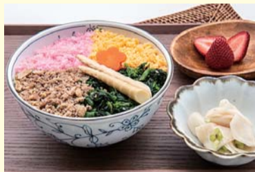
メニューA 春の彩り そぼろ弁当 (ベジ軽弁当)