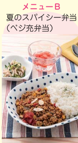
メニューB 夏のスパイシー弁当 (ベジ充弁当)