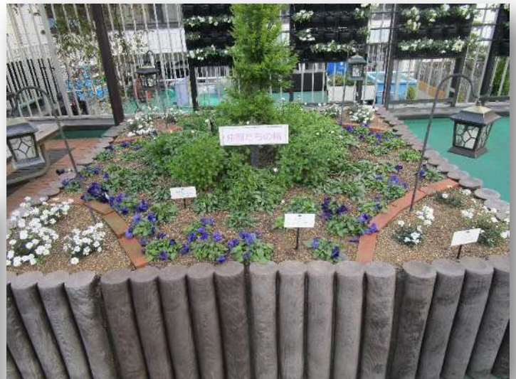
区役所 緑と花のいこいガーデンの冬花壇