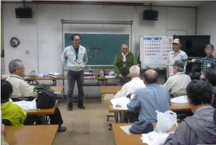
3-1 「しおり」「リース」作り説明