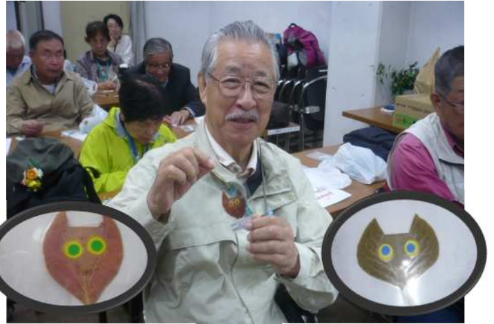
3-2 「しおり」落ち葉のしおり完成