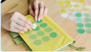
(株)扶桑 「特殊印刷シール～アイロン 不要の布用シールirodo」