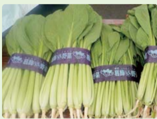
小松菜や大根などの冬野菜