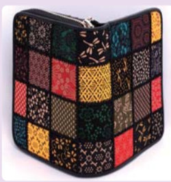
(株)印伝矢部 印伝(財布 バッグ)