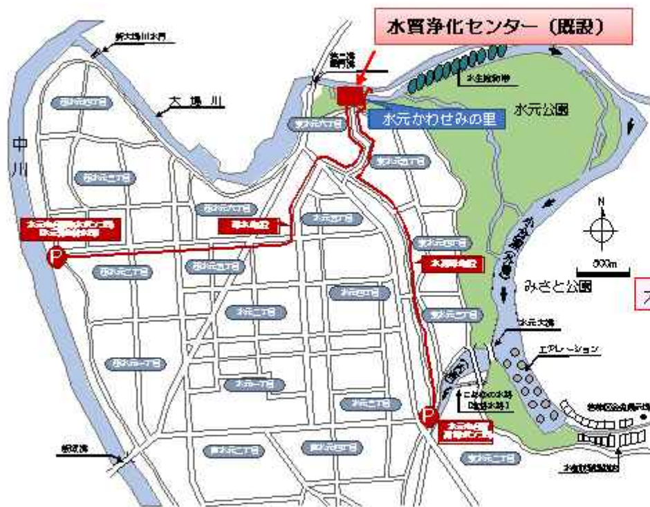
図 1-1 案内図