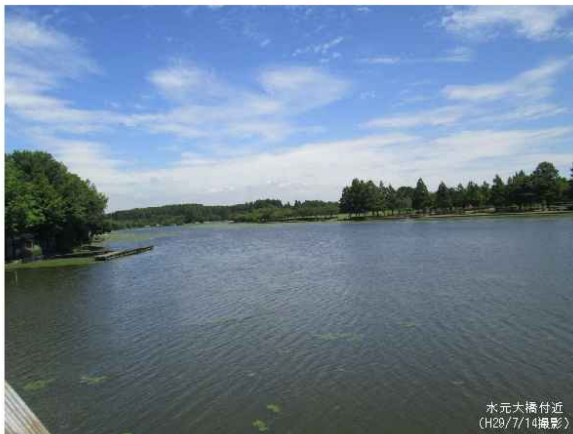
水元大橋付近 (H20/7/14撮影)