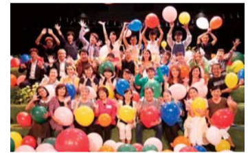
第3回かつしか文学賞「天のこゝろ」の舞台公演