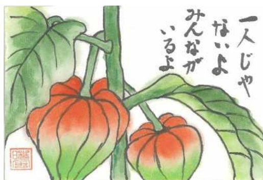
令和5年度花と緑のはがきコンクール 区長賞作品