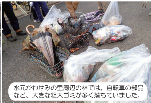
水元かわせみの里周辺の林では、自転車の部品など、大きな粗大ゴミが多く落ちていました。