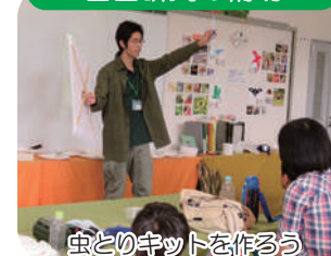
虫とのキットを作る

水辺の生きもの調査、図鑑作りなど、様々な内容の自由研究のイベントを行い、夏休みの児童への、学習のサポートをします。