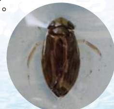
▲葛飾区では、汽水環境を好む近縁種のクロチビミズムシも見られる。

3月中旬を過ぎると、水元公園の水辺から「ジージー」という音が聞こえてくる場合があります。これは、ハイロチビミズムシという体長3mm前後の極小の昆虫の鳴き声です。繁殖期である春先だけ聞こえる、春の訪れを告げる音の一つです。