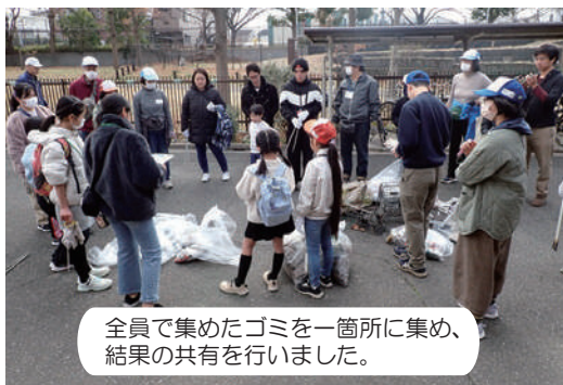
全員で集めたゴミを一箇所に集め、結果の共有を行いました。