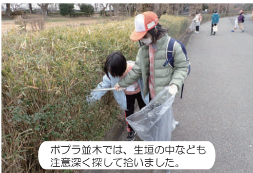
ポプラ並木では、生垣の中なども注意深く探して拾いました。

2月22日に、キッズボランティア活動で、水元かわせみの里周辺からキャンプ広場手前までのポプラ並木でゴミ活動を行いました。どのようなゴミが多く、どのような場所によく落ちていたかなどを調べ、ゴミのポイ捨てをどうしたら減らせるかについて、皆で考えました。