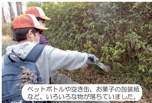
ペットボトルや空き缶、お菓子の包装紙など、いろいろな物が落ちていました。