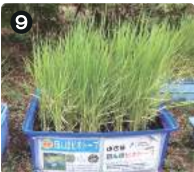
7/14 イネ 水元かわせみの里で、田んぼピオトープとしてコンテナで育成中のイネ。トンボ類やその幼虫などが見られる。