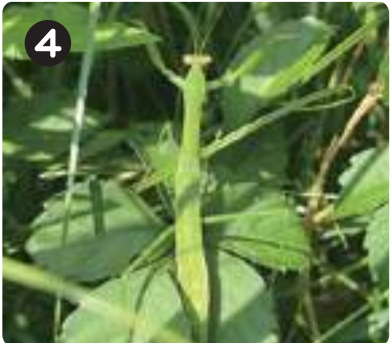
7/8 オオカマキリ(幼体) 草原に潜むハンター。5月中頃に孵化が始まり、7月頃には成体が見られるようになる。