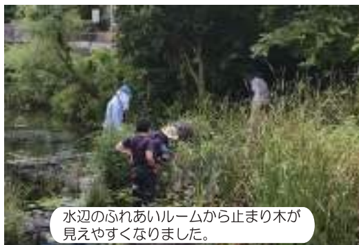
水辺のふれあいルームから止まり木が見えやすくなりました。