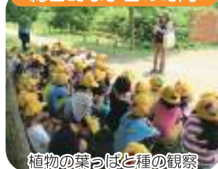
植物の葉っぱと種の観察

水元小合溜周辺の身近な生きものや、環境、歴史について楽しく学びます。水質浄化センターの見学なども可能です。