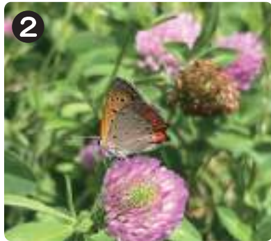
7/8 ムラサキツメクサ・ペニシジミ 5月から8月にかけて赤紫色の花を咲かせる。蜜を求めて多くの昆虫が集まる。