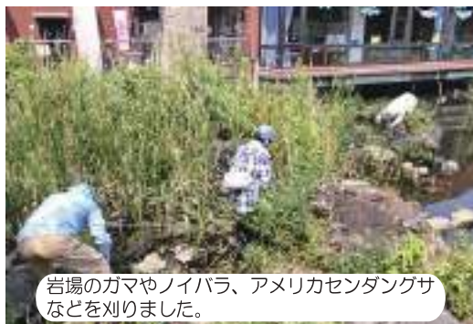
岩場のガマやノイバラ、アメリカセンダングサなどを刈りました。

7月10日(木)に、水辺のふれあいルーム前の水辺に茂った低木や水草の一部を刈り取り、飛来するカワセミが観察しやすいようにしました。また、ハーブ園の整備も行い、ハーブやハーブに飛来する昆虫類の観察がしやすいようにしました。