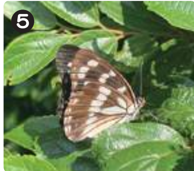
7/8 ゴマダラチョウ 樹液に集まるチョウの一種。産卵のためか、エノキの近くの葉にとまる姿が見られた。