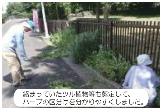
絡まっていたツル植物等も剪定して、ハーブの区分けを分かりやすくしました。