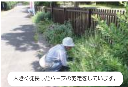
大きく徒長したハーブの剪定をしています。