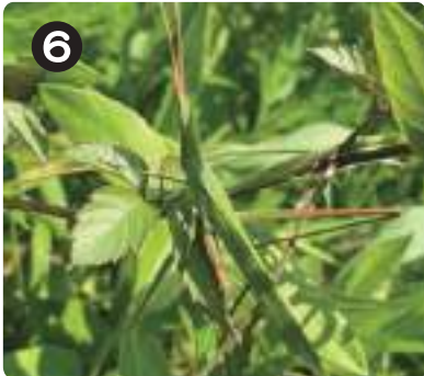
7/8 ショウリョウバッタ 草原にいる後ろ足が立っているバッタ。成体のオスはキチキチと鳴きながら飛び。