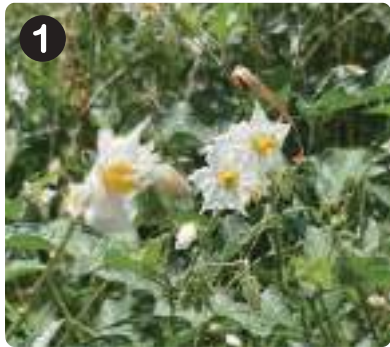
7/8 ワルナスビ 白や薄紫の花を咲かせるナス科の植物。鋭いとげがあるため触る際は注意が必要。