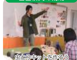
虫とのキットを作る

水辺の生きもの調査、図鑑作りなど、様々な内容の自由研究のイベントを行い、夏休みの児童への、学習のサポートをします。