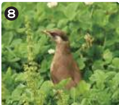
7/8 ムクドリ(幼鳥) 成鳥は黒褐色だが若い個体は黒みが少なく褐色。繁殖が終わり、群れで活動する姿が見られる。