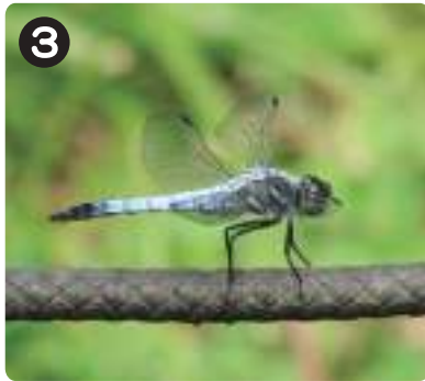
7/8 コフキトンボ 水元公園内の水辺で見られるトンボの一種。オスは成熟すると青白い粉を吹く。