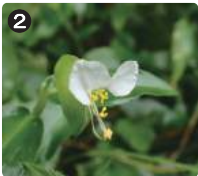
8/11 シロバナツユクサ 花卉が白くなったツユクサの突然変異種とされる。中央広場周りの園路脇で咲いていた。