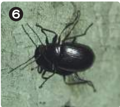
8/9 キマワリ 主に夜、木の幹などでよく見られる。木を周るように歩くことから『木廻り』と名付けられた。