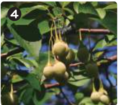
8/11 エゴノキの実 中央広場で沢山実っていた。実に穴が空いているものは、エゴシギソウムシに産卵されたもの。