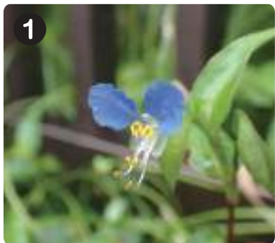
8/11 ツユクサ ハーブ園でハーブに混ざり、青色の花を咲かせていた。花卉を潰すと青い汁が出る。