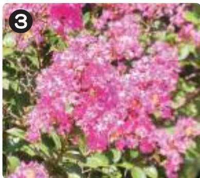
8/1 サルズベリ 夏から晩秋にかけてピンク色の花を咲かせる。赤や白の花を咲かせるものも見られる。