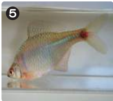
8/3 タイリクバラタナゴ 中国大陸から入ってきたとされる外来種。夏の繁殖シーズンは鮮やかな婚姻色が出る。