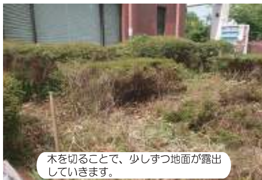
木を切ることで、少しずつ地面が露出していきます。