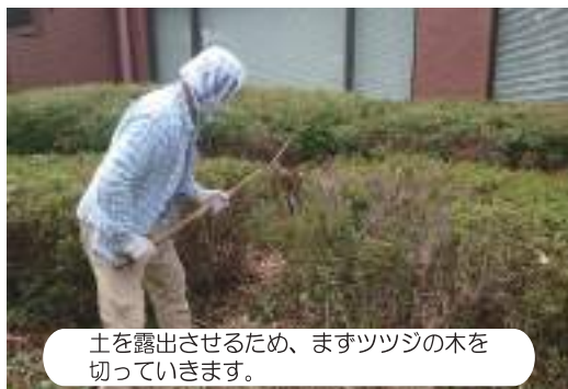
土を露出させるため、まずツツジの木を切っていきます。

7月中旬から8月にかけて、水元かわせみの里入口のツツジを掘り起こし、田んぼに切り替える作業をボランティア・キッズボランティアと協働で開始しました。来年3月を目途に田んぼ作りを終え、春には田植えができるよう、少しずつ準備を進めています。