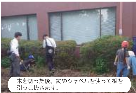
木を切った後、鋤やシャベルを使って根を引っこ抜きます。