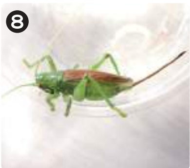
8/2 コロギス コオロギとキリギリスを足して2で割ったような外見を持つ。キャンプ場で素早く木を登っていた。