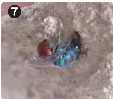
8/9 ツマムラサキセイボウ 青色の光沢をもつ寄生バチ。スズバチの巢に穴を空け、産卵しようとしていた。