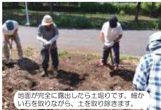
地面が完全に露出したら土堀りです。細かい石を取りながら、土を取り除きます。