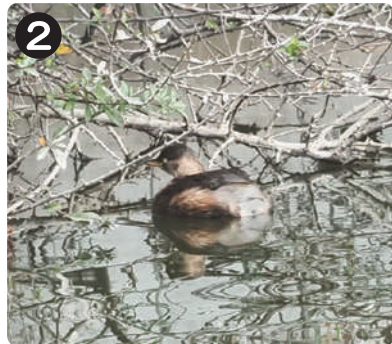
2/17 カイツブリ 水元かわせみの里で潜って魚を食べる姿が見られた。ここ数年は2羽揃って姿を見ることが多い。