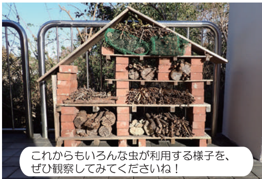
これからもいろんな虫が利用する様子を、ぜひ観察してみてくださいね！