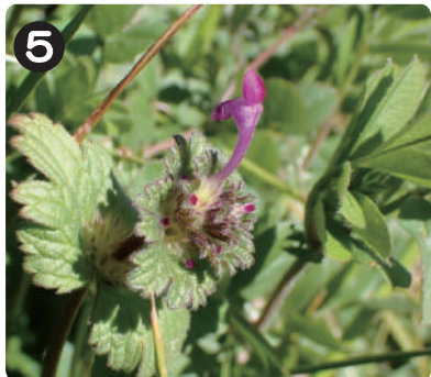
2/5 ホトケノザ 紫色の花を咲かせていた春の草本。日当たりのいい草地によく生えるため、水元公園中で見られる。