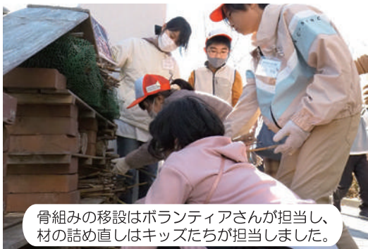
骨組みの移設はボランティアさんが担当し、材の詰め直しはキッズたちが担当しました。