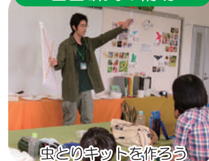
虫とのキットを作る

水辺の生きもの調査、図鑑作りなど、様々な内容の自由研究のイベントを行い、夏休みの児童への、学習のサポートをします。