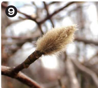
2/17 コブシの花芽 キャンプ場手前のヨシ原で見られる。フサフサの毛皮のコートのような姿で冬をしのいでいた。

2 ● 写真を撮った場所を地図上に示してありますが、他の場所でも見られます。皆さんもぜひ見つけてみましょう。