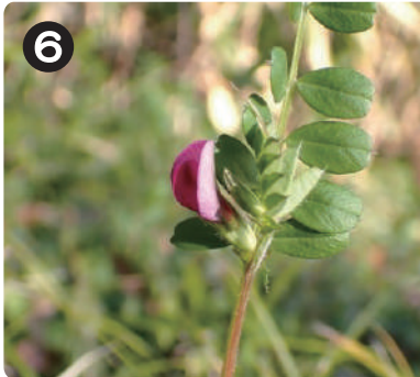
2/5 ヤハズエンドウ 紫色の花を咲かせていた春の草本。水元公園中で見られ、茎にはよくアブラムシがつく。