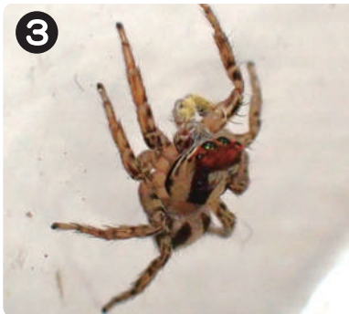
2/17 ミスジハエトリ 水元かわせみの里に設置したむしむしハウスの中で越冬していた。背中の中本の線が特徴。