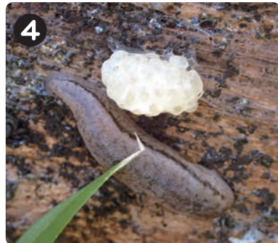
2/16 チャコウラナメクジと卵 野草園の朽木の裏に隠れていた。白い塊は卵で春先によく産卵する。