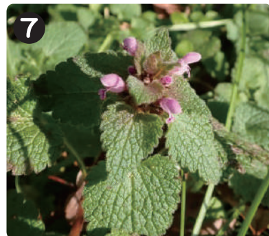
2/5 ヒメオドリコソウ 小さな桃色の花を咲かせていた春の草本。水元公園中で見られる。茎が四角いのが特徴。