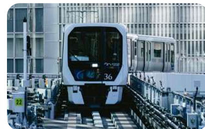
▲東京臨海新交通臨海線『ゆりかもめ』

別名『都鳥(みやこどり)』とも呼ばれ、昭和40年に東京都の『都民の鳥』に指定されました。東京港を走る東京臨海新交通臨海線の電車にも、この鳥の名前が使われています。