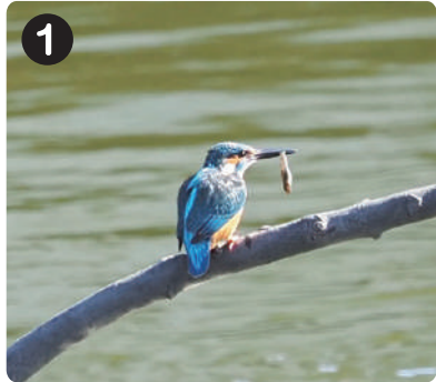
2/14 カワセミ 水元かわせみの里でほぼ毎日見られる。かわせみの里の工事が終わり、目立つ所にとまるようになった。