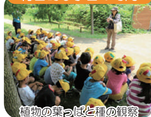
植物の葉っぱと種の観察

水元小合溜周辺の身近な生きものや、環境、歴史について楽しく学びます。水質浄化センターの見学なども可能です。