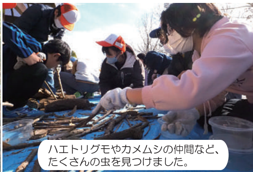
ハエトリグモやカメムシの仲間など、たくさんの虫を見つけました。