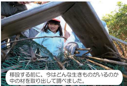
移設する前に、今はどんな生きものがあるのか中の材を取り出して調べました。

むしむしハウスとは、冬越しする虫たちの隠れ場所となるよう、植物の枝や石などを集めて隙間を集合したものです。元々は施設入口の通路脇に設置していたのですが、10～1月の外壁工事に伴いパーゴラへ移していました。2月11日(日)にこれを元の場所へ戻しました。