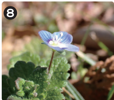
2/5 オオイヌノフグリ 青色の花を咲かせていた春の草本。水元公園中で見られる。花にはハエの仲間が良く集まる。