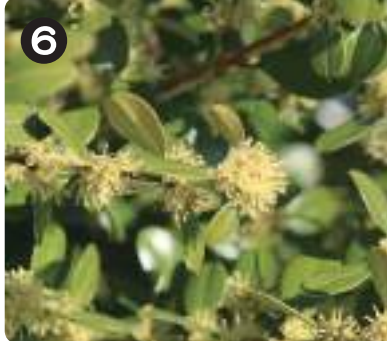
3/8 ハマヒサガキ 水元公園の生垣でよく見られる。小さな花が連なるように咲いていた。