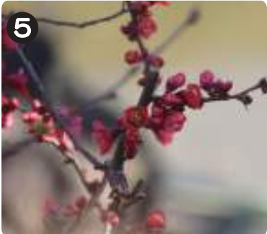
3/8 クサボケ 水辺のふれあいルーム前の水辺で咲いていた。冬から早春に咲く赤い花がよく目立つ。