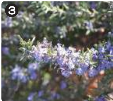
3/8 ローズマリー 水元かわせみの里のハーブ園で見られる。葉をこするとスッパリとした香りがする。