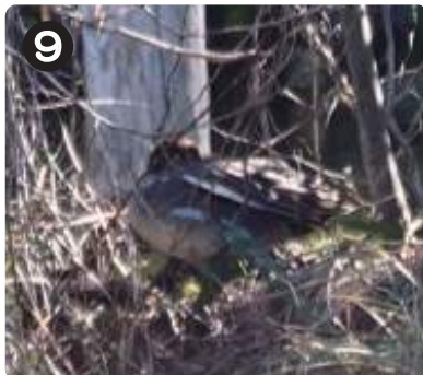
3/8 コガモ かわせみの池で休憩していた。渡りに向け、オスがメスに求愛する姿が時折見られる。

● 写真を撮った場所を地図上に示してありますが、他の場所でも見られます。皆さんもぜひ見つけてみましょう。