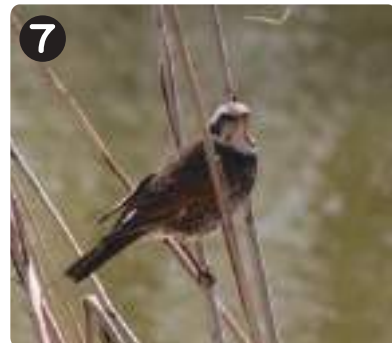
3/8 ツグミ 胸をピンと張るようにしてとまり、地面において枯葉の下の虫を探していた。