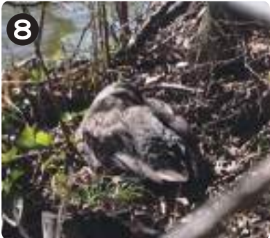
3/8 カルガモ 全体に黒褐色で、顔は白っぽく、二本の黒褐色線がある。水元公園全域で、通年で見られる。