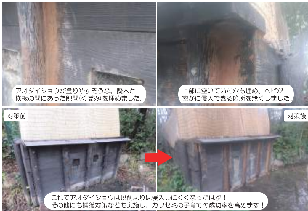
アオダイショウが登りやすそうな、擬木と横板の間にあった隙間(くぼみ)を埋めました。

水元かわせみの里では、毎年のようにカワセミが営巣壁で繁殖活動を行っていますが、過去5回、天敵であるヘビ(アオダイショウ)に卵や雛を食われ、繁殖に失敗してしまった例もあります。そこで、ヘビが巣穴に侵入しづらくなるよう、営巣壁に対策を施しました。