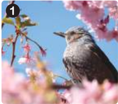
3/8 ヒヨドリ ポサボサ頭に茶色いほっぺが特徴的。「ヒーヨ、ヒーヨ」と鳴く。花の蜜や花びら、果実が大好物。