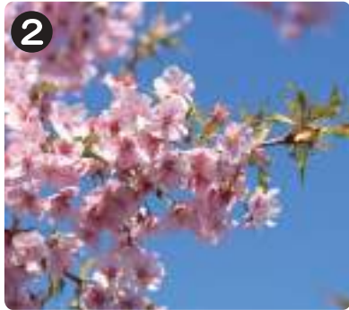
3/8 カワツクラ 春の到来を象徴する花の一つ。水元かわせみの里近くで咲いていた。今は花が散り、葉を広げている。