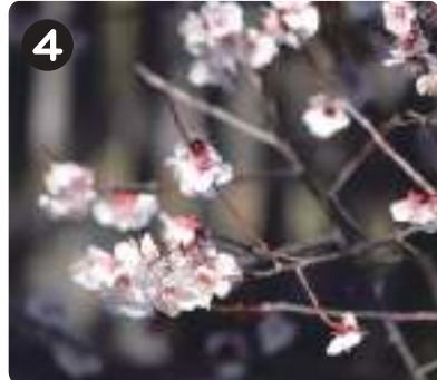
3/8 フンゴウメ 水元かわせみの里内の樹の橋の近くで咲いていた。花が散った後、大きな果実をつける。