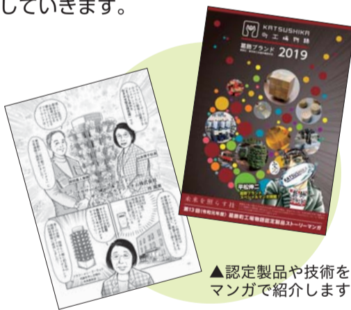
▲認定製品や技術をマンガで紹介します

認定企業からは、「葛飾ブランドによる見本市などの出展がきっかけで企業同士の交流が深まり、販路拡大に役立った」との声が寄せられています。