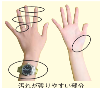
汚れが残しやすい部分