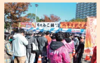
昨年は約80,000人が来場!