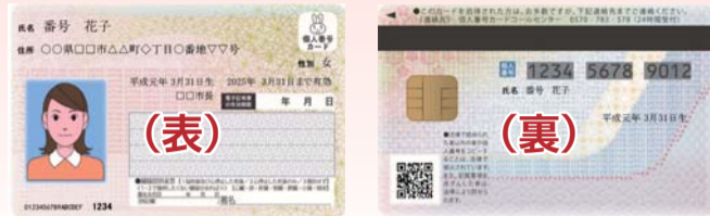
マイナンバー(個人番号)カード