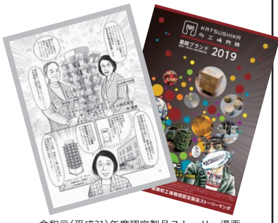
令和元(平成31)年度認定製品ストーリー漫画

【対象】 認定製品・技術の取材を行い、打ち合わせなどを行った上で漫画化できる方(プロ・アマ不問)3人程度 【内容】 1作品6ページの漫画(1人につき1作品を予定) 漫画に関する著作権・使用権など、全ての権利は葛飾区および東京商工会議所葛飾支部に帰属します。 【報酬】 1作品につき10万円 【募集期限】 8月28日(金)(必着) 【応募要領・申込書配布場所】 商工振興課 葛飾町工場物語ホームページ( https://katsushika-brand.jp/ )からも取り出せます。 【応募方法】 応募用の設定ストーリーを2ページの漫画にし、所定の申込書と共に持参か郵送(提出書類は返却しません)。 【審査方法】 書類審査・面談の上、9月下旬に決定します。 【応募・担当課】 〒125-0062 青戸7-2-1 テクノプラザ かつしか内 商工振興課 ☎03-3838-5587