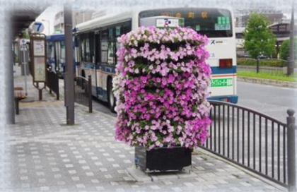
駅前のちょっとした空間に (JR金町駅南口)