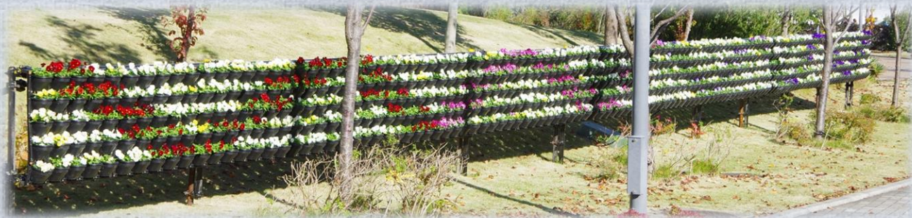
キャンバスに描くように (臨海副都心「花と緑」のおもてなしプロジェクト展示協力)