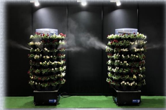
まちの彩りと微細ミストで暑熱対策