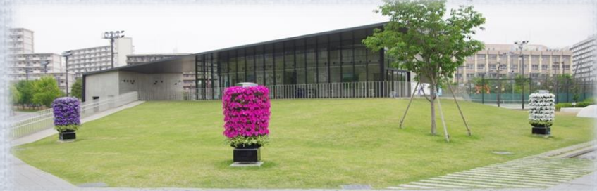
公園などの開けた空間に (葛飾にいじゅくみらい公園)