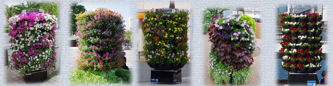
ペチュニア ヘテラ

ヒューケラやコリウスなどのリーフプランツを使ったり、アイビーやツルニチニチソウなどで下垂を活かすなど、思い思いに四季折々の装飾をお楽しみいただけます。