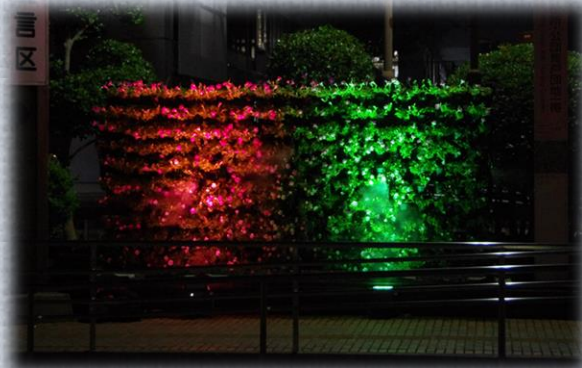
夜間はLED照明で演出