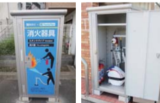
▲消火器とスタンドパイプ

区では、火災発生時に地域住民の方が素早く初期消火を行い、被害を最小限に抑えられるよう、大手コンビニエンスストア3社と「店舗への消火器具設置に係る協定」を締結し、区内のコンビニエンスストアに消火器具の設置を行っています。