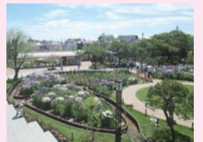
静観亭からの眺め