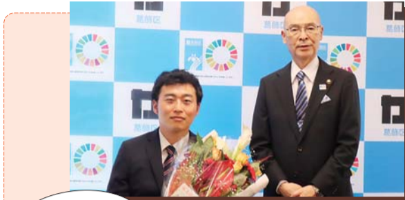
パラアーチェリー男子個人(W1クラス)出場