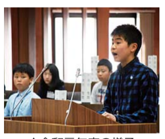
▲令和元年度の様子

区に対する要望や提案などを区議会本会議場や委員会でも発表する、議員体験をしてみませんか。区長・教育長などが、皆さんの意見にお答えします。議会の仕組みなどを学ぶこともできます。参加者には図書カード(2,000円分)を差し上げます。 【日時】 12月24日(金)午後1時30分～5時 事前学習会を8月19日(木)に開催予定です。 【会場】 区議会本会議場・委員会室(立石5-13-1) 【対象】 区内在住の小学5年生～中学3年生15人 【申込方法】 ハガキに「子ども区議会」・住所・氏名(フリガナ)・生年月日・電話番号・学校名・学年・保護者の氏名・過去の申込回数を書いて、5月26日(水)(必着)まで(多数抽選)。 【申し込み・担当課】 〒124-8555葛飾区役所すぐやる課 ☎03-5654-8448